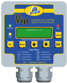
VIP5 编号 1639141